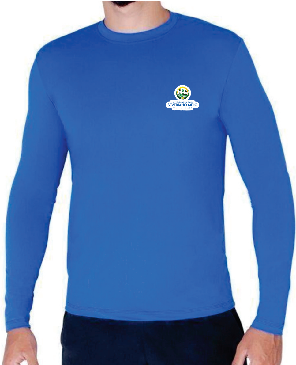
Blusa de proteção solar com logo da prefeitura